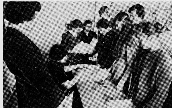
НА СНИМКЕ: Сдача первого курсового проекта — это не только получение отметки. Преподаватель разъяснит непонятное, подскажет, как можно было сделать учебное задание еще лучше, даст совет на будущее.